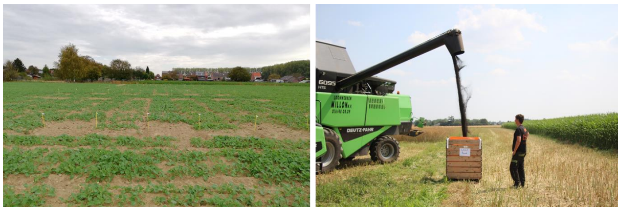
Figuur 2 Demonstratieproef koolzaad – proef in oktober 2018 (links) en oogst in juli 2019 (rechts).

Koolzaad ( Brassica napus ) behoort tot de familie van de koolgewassen of kruisbloemigen (Brassicaceae) en kan men indelen in twee grote groepen: winter- en zomerkoolzaad. Winterkoolzaad is de meest interessante teelt aangezien hij in het najaar de bodem bedekt en dankzij het wortelstelsel erosiewerend werkt. Daarnaast kan winterkoolzaad ook tot 40 % meer opbrengst geven dan zomerkoolzaad. Door de langere teeltduur is er in de winter wel meer kans op schade door bijvoorbeeld duiven.