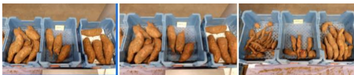
Figuur 2: Verschillende gewichtsklassen van het ras Beauregard (2020).